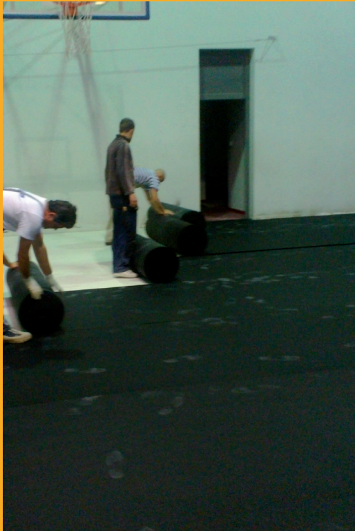
Ugradnja amortizirajućeg sloja na bazi reciklirane gume - Regupol