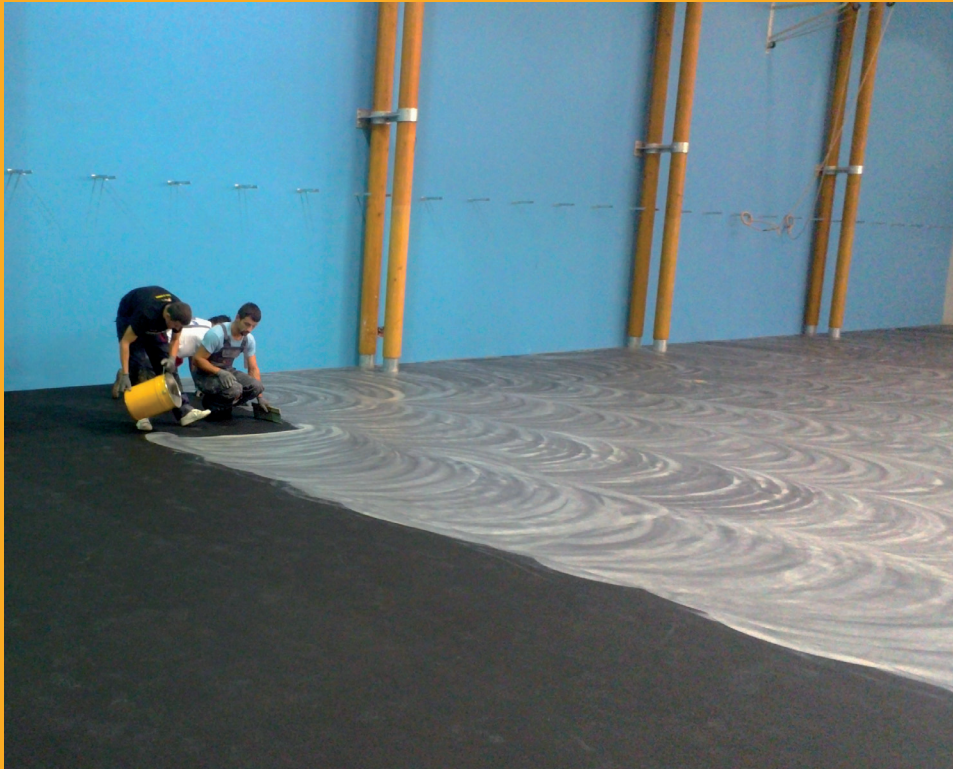
Ugradnja brtvenog sloja - Pulastic® EG